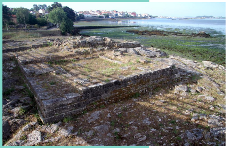
Punta da Torre. Castelo da Lúa. De orixe medieval, foi abandonado no século XVII