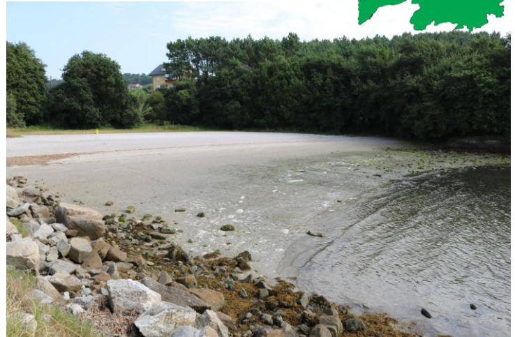
Praia de Taragoña