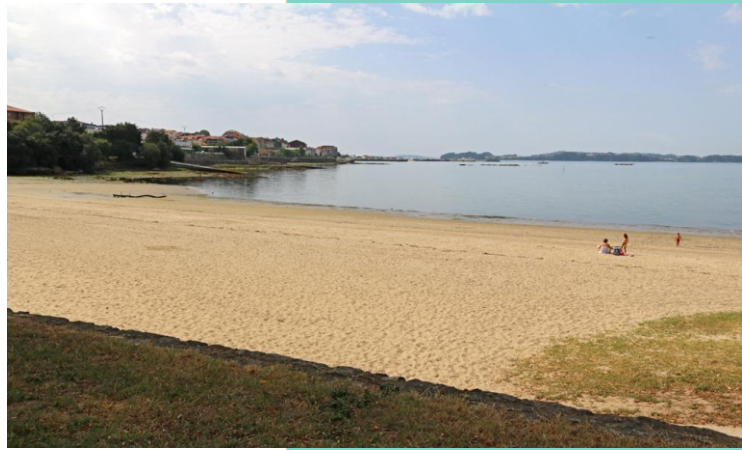
Praia do Pazo