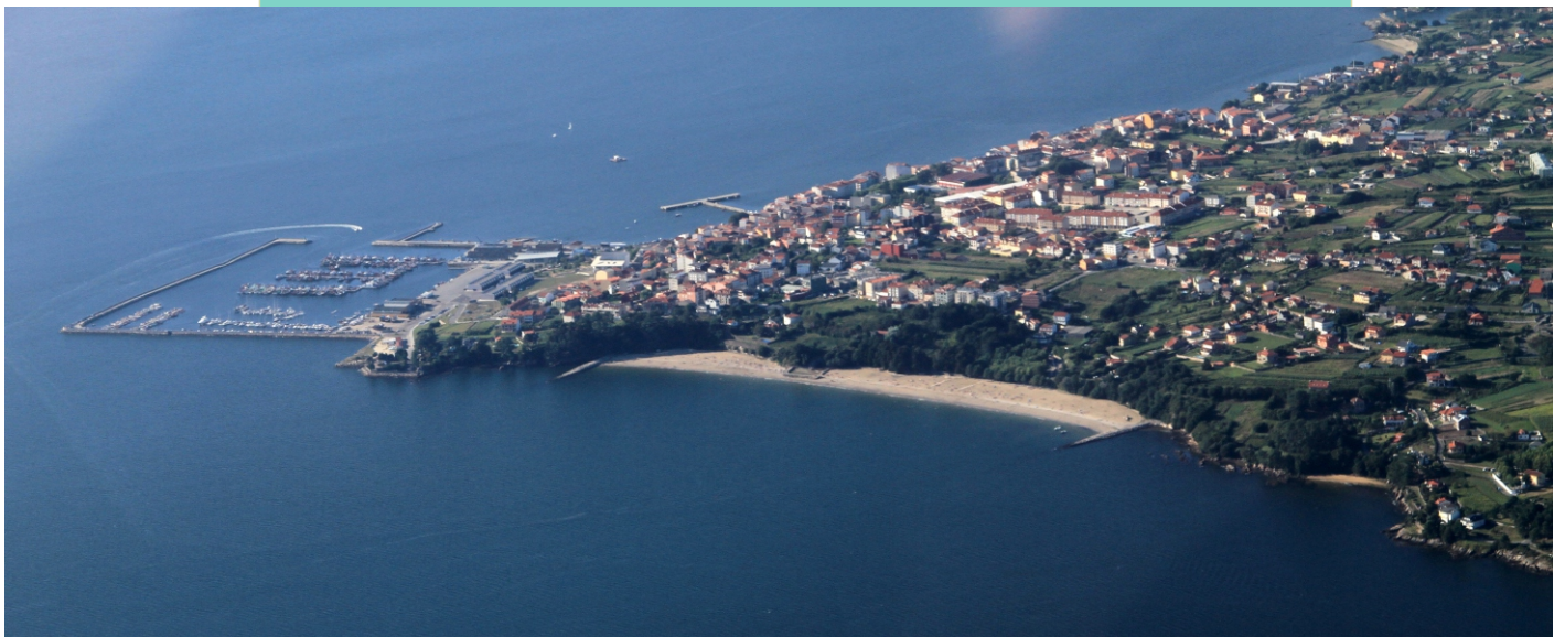
Vista aérea de Rianxo co porto e as praias do Quenxo e Tanxil, separadas polo antigo portoiño de Cortes.