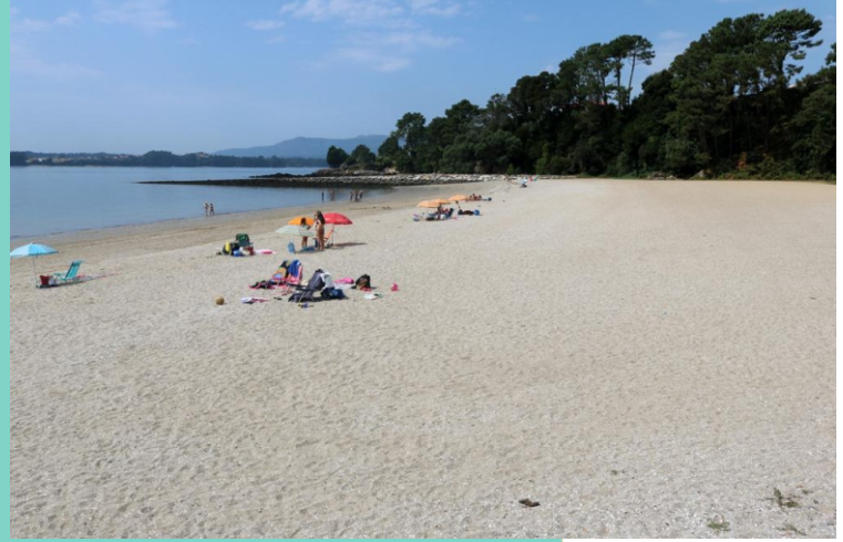
Praia de Quenxo