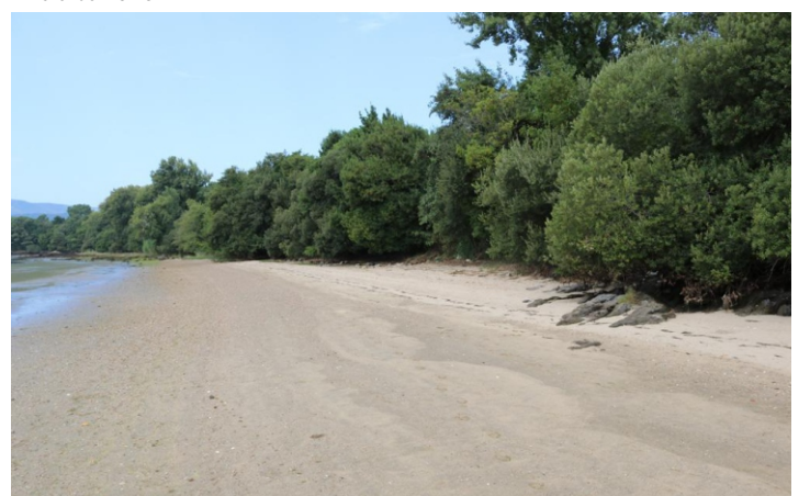
Praia de Susolmos