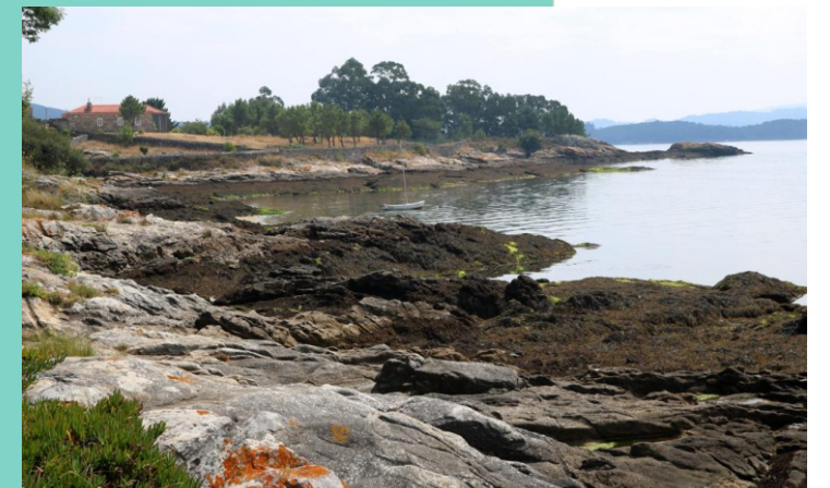
Punta do Salto do Ladrón