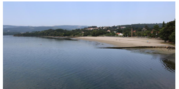
Praia da Torre