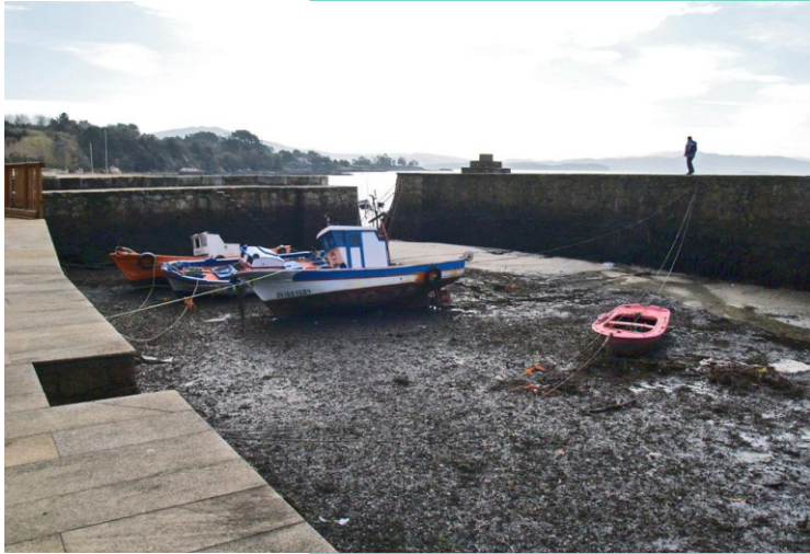
O pequeno porto de Cortes está actualmente medio soterrado entre os areais de Quenxo e Tanxil (despois das obras de rexeración das praias). (Imaxe do 2006).