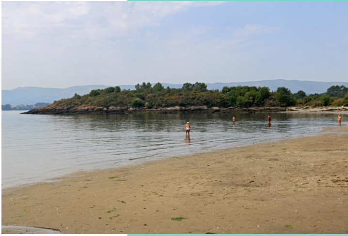
Punta do Castro