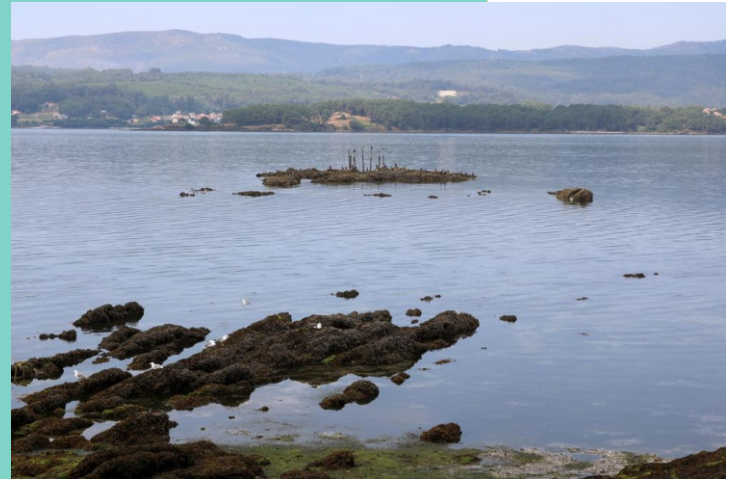
O Sinal de Rinlo