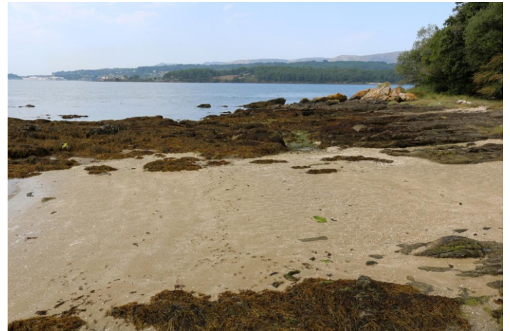
Punta de Iñobre