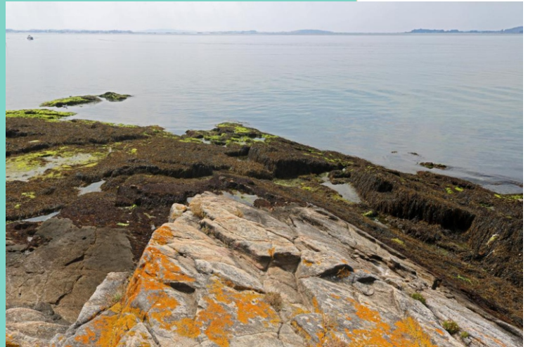
Punta de Redemuíños