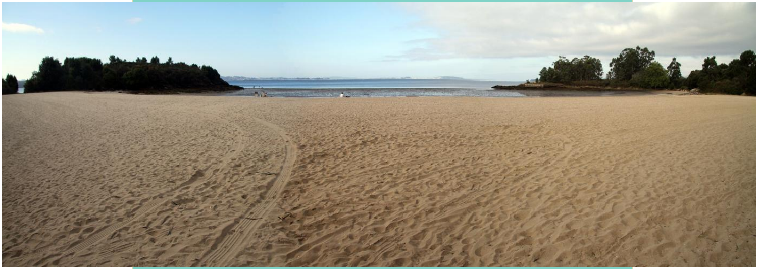
18-Praia do Porrón, entre a Punta do Salto do Ladrón e a Punta do Castro