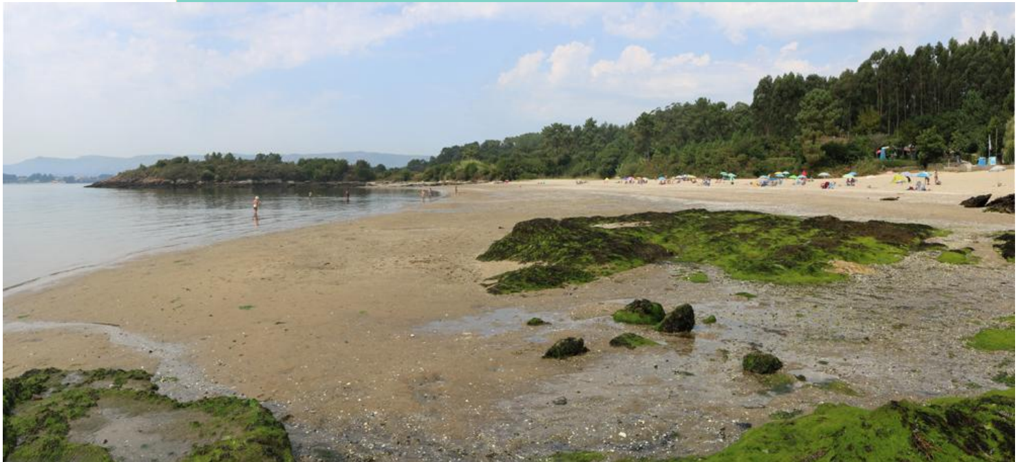
Praia das Cunchas (entre as puntas do Castro e Sebeira)