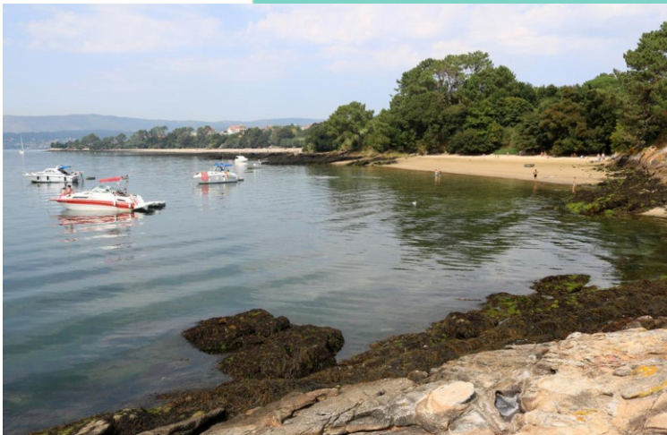
Praia do Tronco