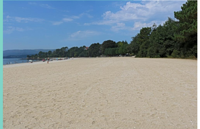
Praia de Tanxil e porto de Cortes