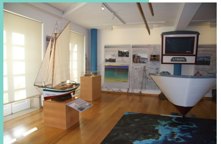
Museo do Mar de Rianxo